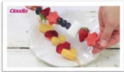
Przepis na owocowe szaszłyki.

Czasem rodzina idzie do kina, a czasem kino mamy u siebie. Obejrzyj bajkę z mamą i tatą. Jaka? Wybór należy do Ciebie. Z okazji święta wszystkich dzieci – pyszny popcorn do was leci. A może owoce smaczne i zdrowe? Na bajkę zaraz będą gotowe. Usiądź więc z Mamą i Tatą smyku – bo niespodzianek dzisiaj bez liku.