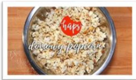
Przepis na domowy popcorn.